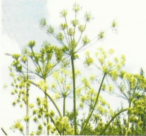
Fot. 2. Kwitnące baldachy