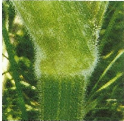
Fot. 3. Pęd pokryty włoskami