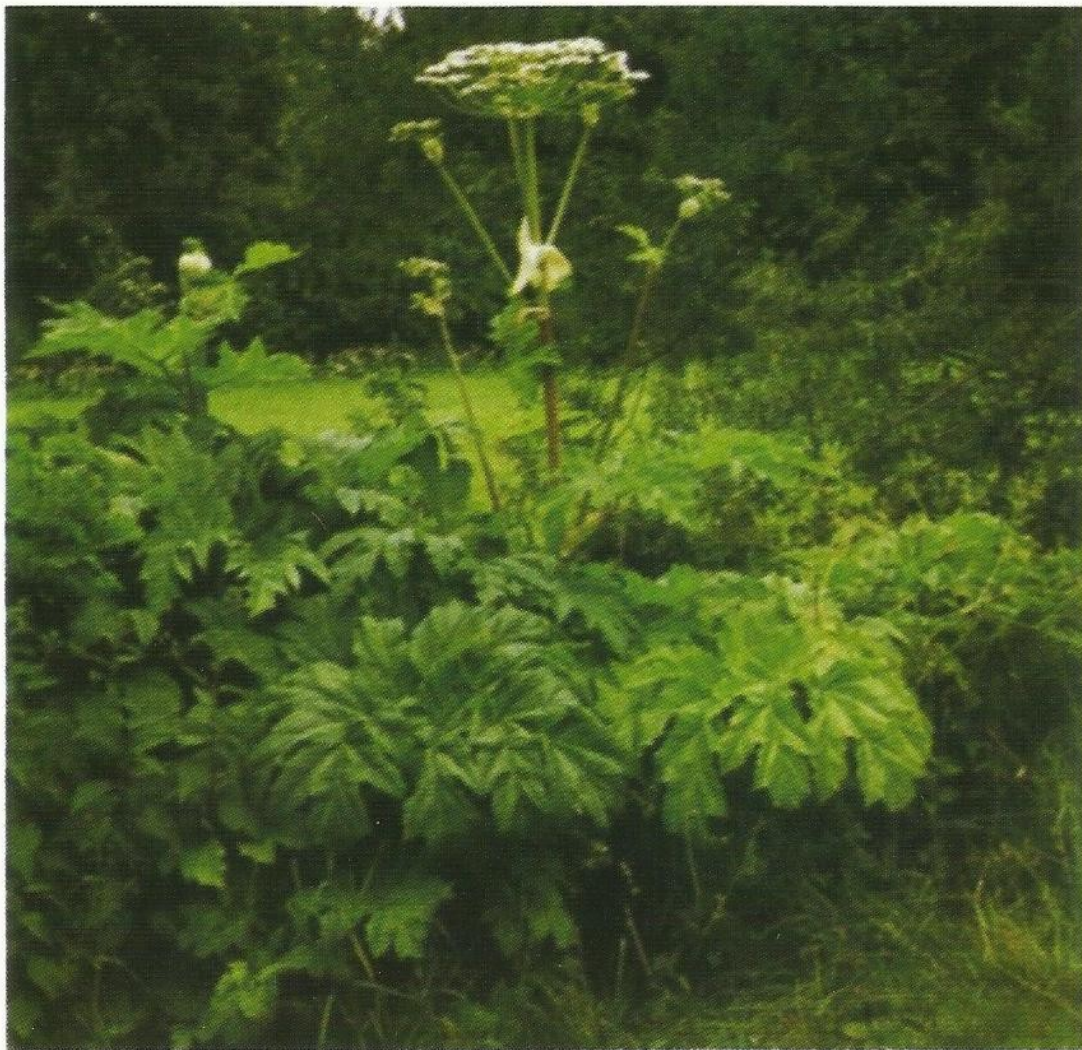
Fot. 1. Kwitnąca roślina barszczu Sosnowskiego