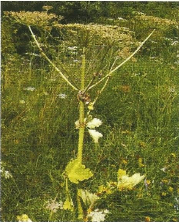
Fot. 4. Pęd z dojrzewającymi baldachami (rozłupkami)